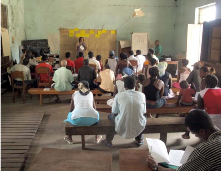
Préparation du plan de gestion du Parc Obo de São Tomé (ECOFAV IV – Sept.08)