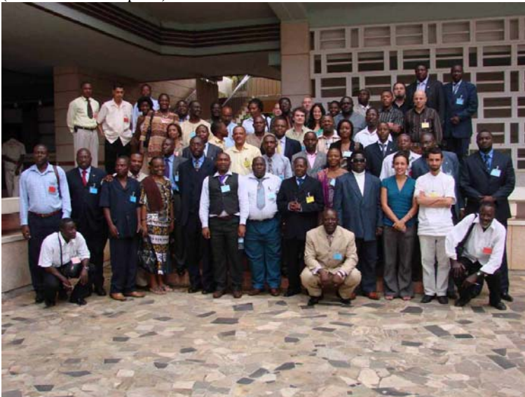
Participants à l'atelier du RAPAC en São Tomé