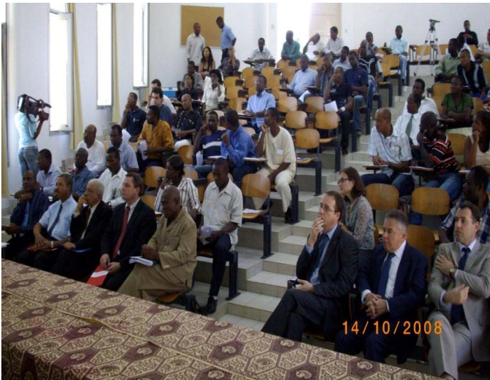
DGE, Ministre de E&F, Chef de la Délégation, staff de la DCE et Ambassadeur du Portugal participant à la séance de discussion publique sur le Plan de Gestion du Parc de Sao Tomé