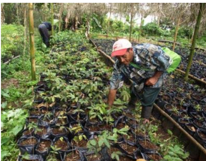
Pépinière au Jardin Botanique de Bom Sucesso (Parc Naturel Obo de São Tomé)