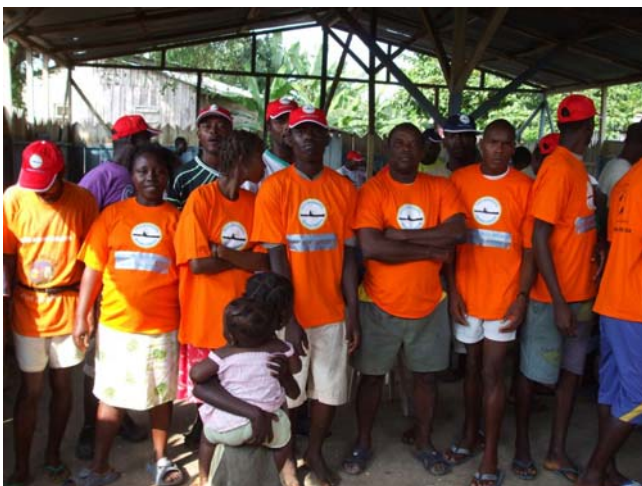
Bénéficiaires du projet d'appui à la pêche artisanale (MARAPA)